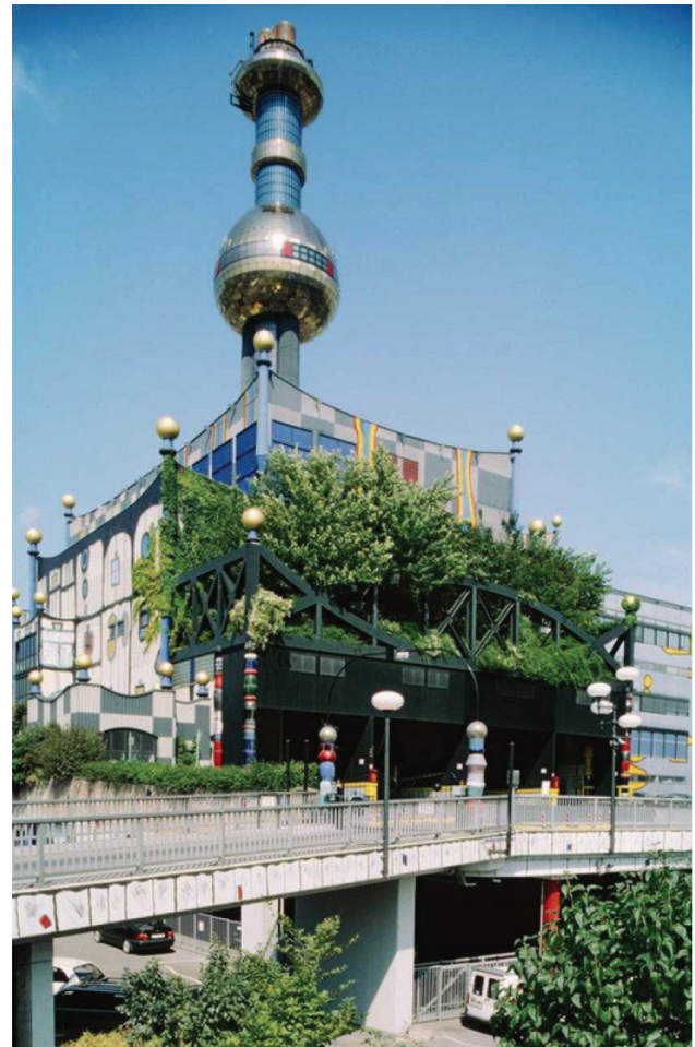
Central Térmica de Spittelau